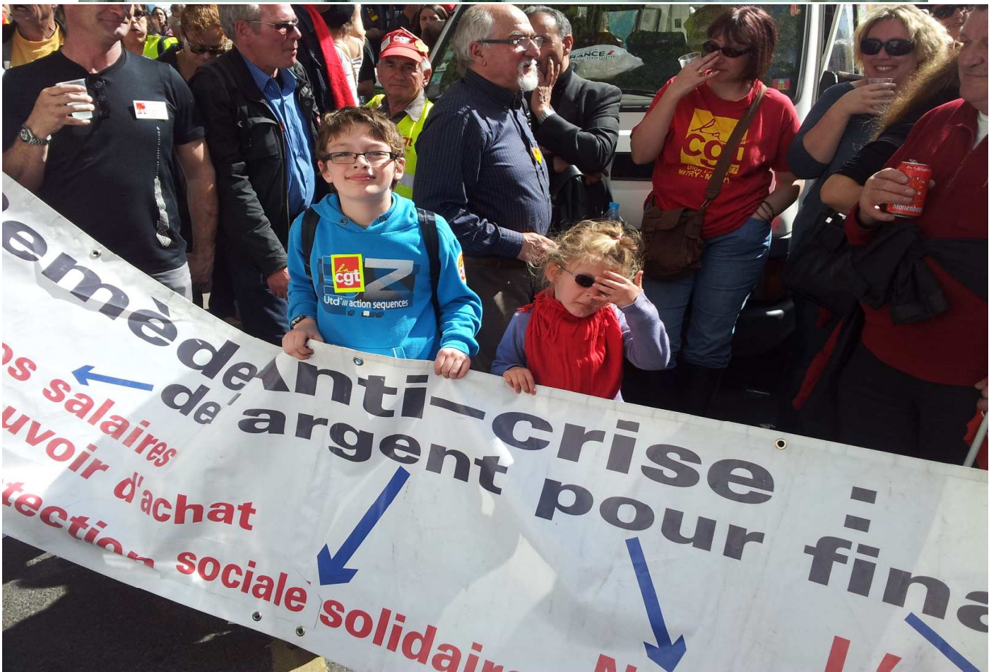
1° Mai 2012 à Paris